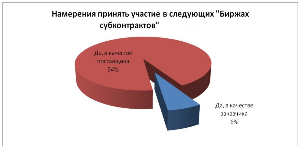
Рис.5. Намерение принять участие в следующих «Биржах субконтрактов».