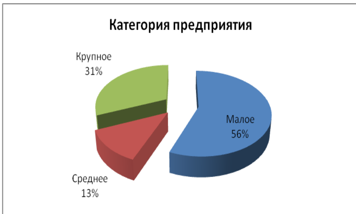
Рис.1 Категория предприятия.