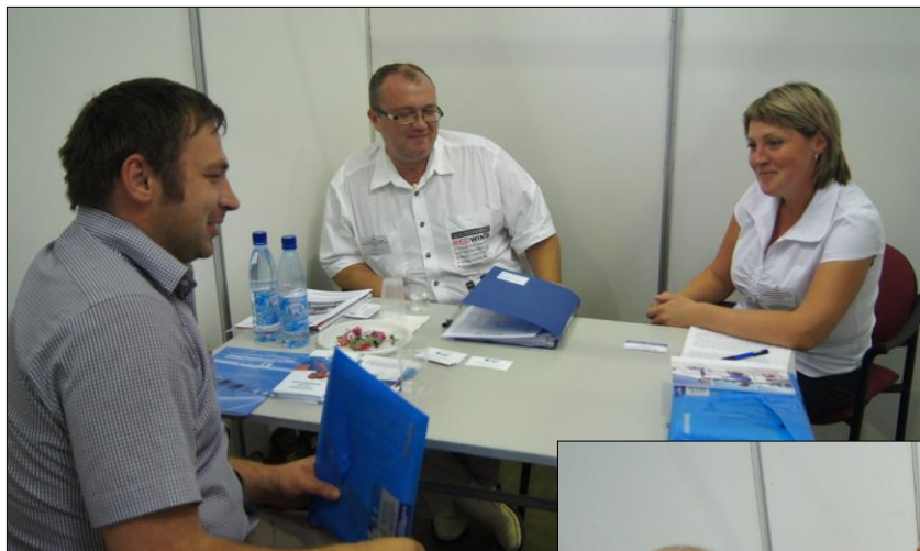
Переговорная площадка ОАО «Гаврилов-Ямский машиностроительны й завод «Агат» (Гаврилов-Ям)

В ходе «Биржи субконтрактов» прошло более 240 переговоров между заказчиками и поставщиками.