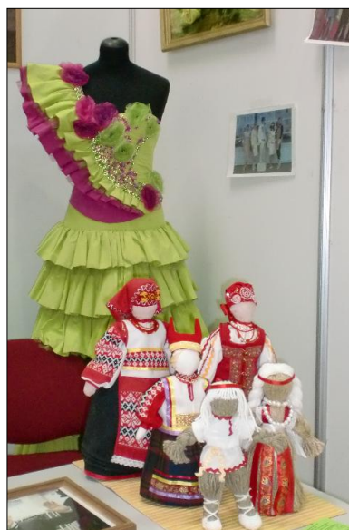
Ярославский техникум управления и профессиональных технологий, ГОУ СПО ЯО