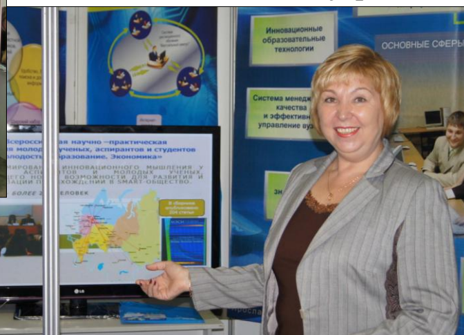
Ярославский филиал Московского государственного университета экономики, статистики и информатики