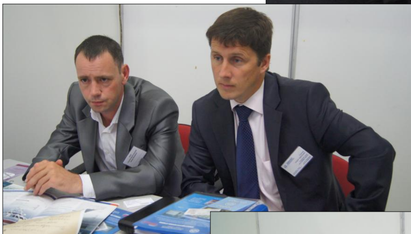
Переговорная площадка ОАО «Судостроительный завод Вымпел» (Рыбинск)