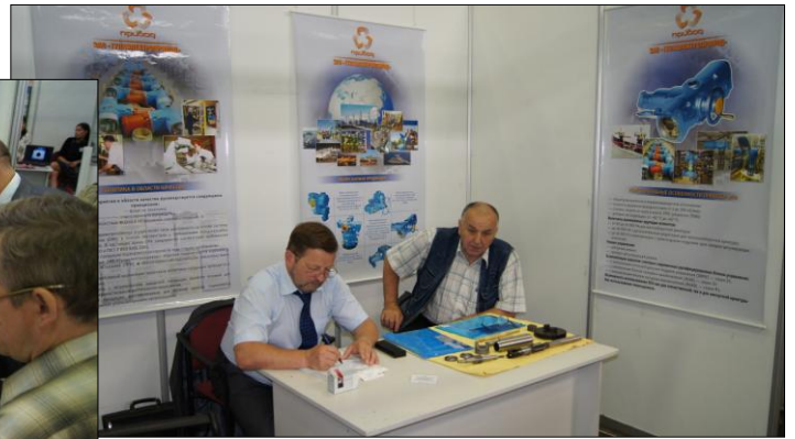
ЗАО «Производственное объединение «Тулаэлектропривод»