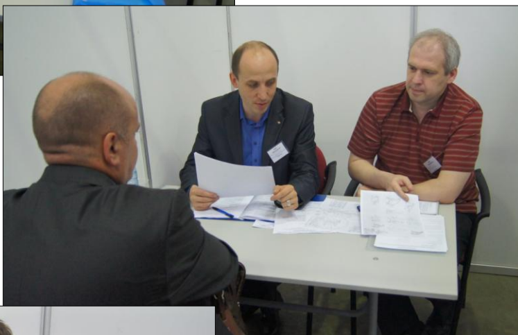
Переговорная площадка ОАО «АВТОДИЗЕЛЬ» (Ярославль)