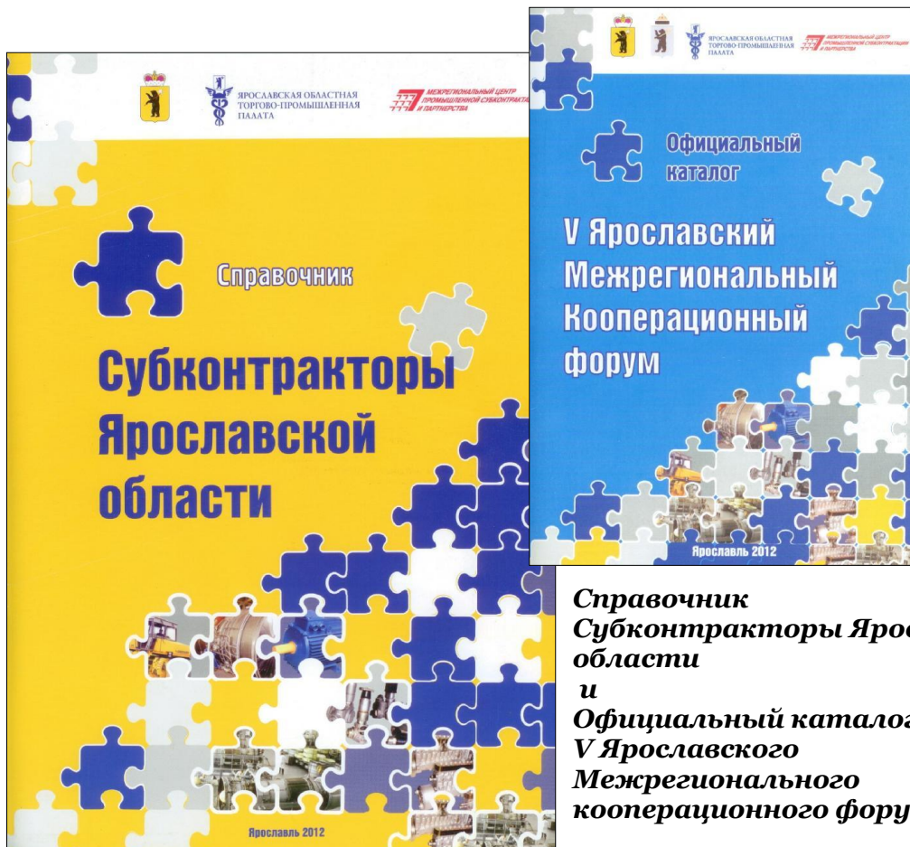
Справочник Субконтракторы Ярославской области и Официальный каталог V Ярославского Межрегионального кооперационного форума

География предприятий-участников V Ярославского межрегионального кооперационного форума: