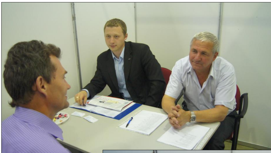
Переговорная площадка ОАО «Ярославский радиозавод» (Ярославль)