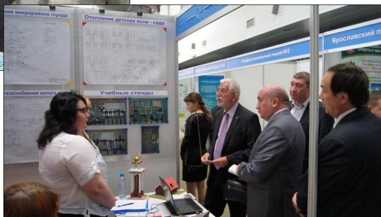
Ярославский градостроительный колледж, ГОУ СПО ЯО