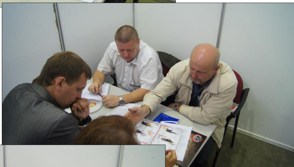
Переговорная площадка ООО «Русская механика» (Рыбинск)