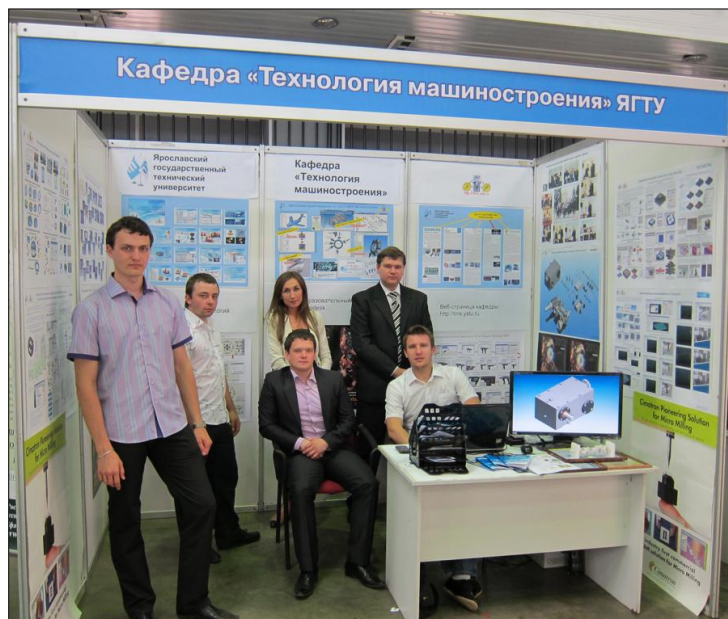
Ярославский государственный технический университет (ЯГТУ) Кафедра «Технология машиностроения»