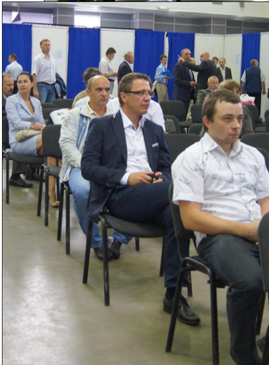
Представители предприятий-исполнителей в ожидании переговоров с Заказчиками