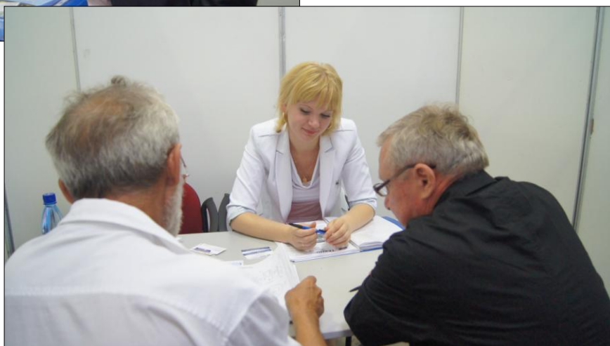
Переговорная площадка ОАО «Галичский Автокрановый Завод» (Галич, Костромская обл.)