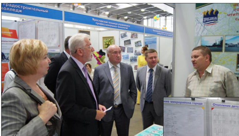
Ярославский промышленно-экономический колледж, ГОУ СПО ЯО