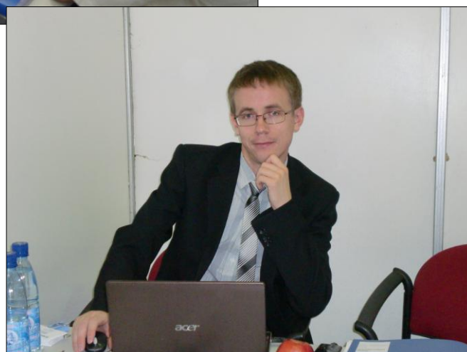
Переговорная площадка ДООО «ИРЗ-Ринкос» (Ижевск, Удмуртская республика)