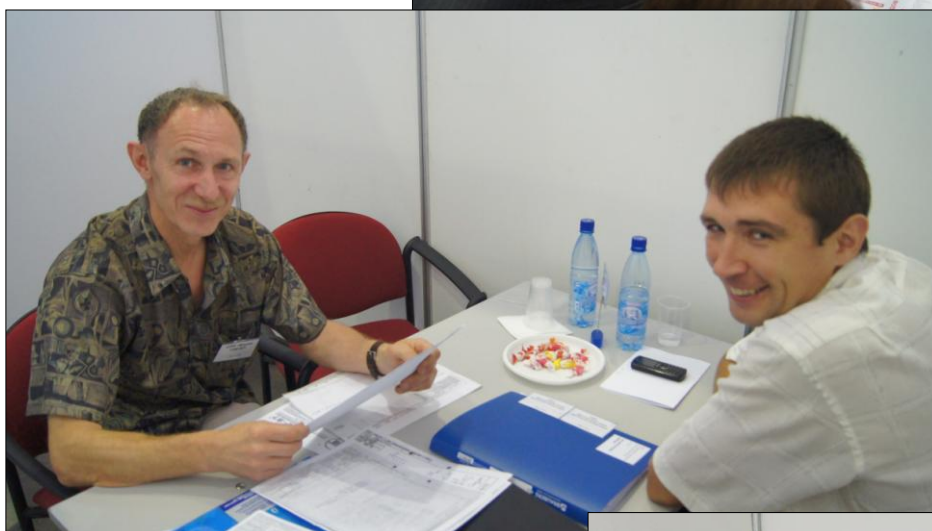
Представитель ОАО «Ярославский завод дизельной аппаратуры» (Ярославль) на переговорах с ООО «Фирма ТОР-97» (Ярославль)